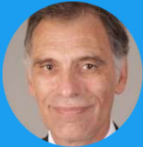
Miguel Ángel Schiavone Presidente de la II Cumbre Iberoamericana en Argentina

El desarrollo sostenible puede considerarse como un proceso omnicomprendido, totalizador, que permite la exteriorización de las potencialidades del ser humano sin comprometer la capacidad de las futuras generaciones. Con el propósito de cuantificar este desarrollo, las Naciones Unidas establecieron los ODS 2015-2030 que, a través de 17 objetivos, integran tres dimensiones esenciales para el bienestar de las personas y la sociedad: el crecimiento económico, la inclusión social y el cuidado del medio ambiente.